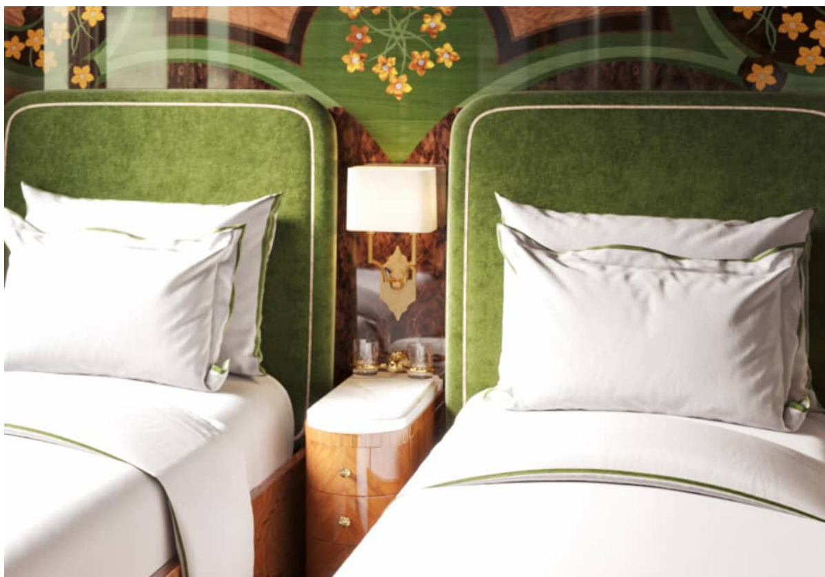
Suite - Twin

Jede Suite versetzt Gäste in verschiedene europäische Landschaften durch prächtige Farben, Muster und Texturen. Ein festes Doppelbett, das tagsüber in eine Lounge-Ecke umgewandelt wird, sowie private en-suite Einrichtungen, einschliesslich einer Dusche, eines Waschbeckens und einer Toilette.