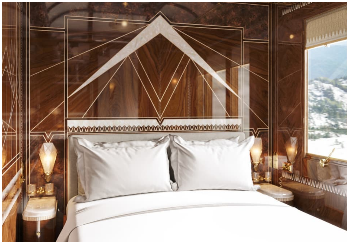
Suite - Double

Jede Suite versetzt Gäste in verschiedene europäische Landschaften durch prächtige Farben, Muster und Texturen. Ein festes Doppelbett, das tagsüber in eine Lounge-Ecke umgewandelt wird, sowie private en-suite Einrichtungen, einschliesslich einer Dusche, eines Waschbeckens und einer Toilette.